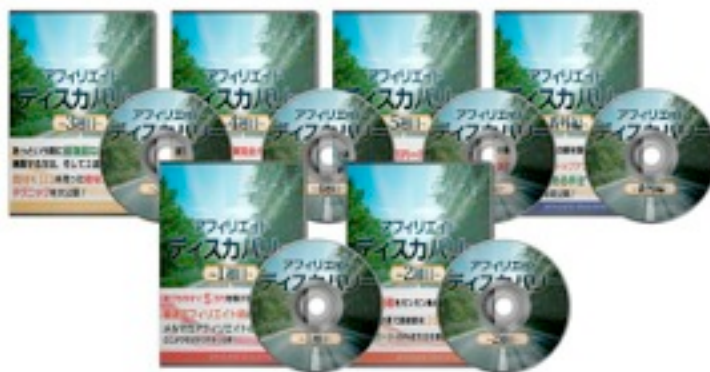
動画コンテンツ 60本以上・9時間