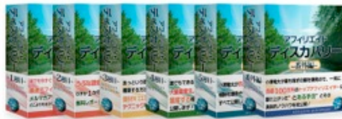
教材本体 1週目～番外編

今回このレポートを最後まで読んでいただいた方へ、特別に『販売者特典』として特典を多数お渡しします。特典の内容は決済ページにてご確認ください。